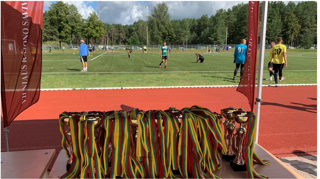
Nuotrauka. 2021 m. Vilniaus rajono seniūnijų sporto žaidynės