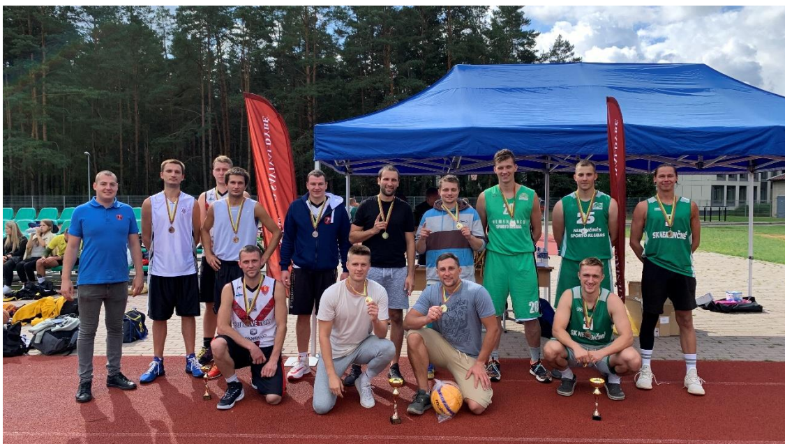
Nuotrauka. 2021 m. Vilniaus rajono seniūnijų sporto žaidynės

Dėl koronaviruso pandemijos šalyje ir nuolatinio draudimu įvedimu sporto veikla buvo ribojama. Dėl to 2021 metais Vilniaus rajono savivaldybei pavyko suorganizuoti 22 sporto renginių, kai 2020 metais buvo suorganizuoti 15 sporto renginiai.