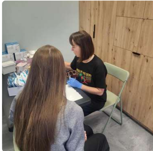
Bendradarbiavimas su „Demetra“ AIDS dienos minėjime

Ypatingas dėmesys 2025 metais buvo skirtas Pasaulinės AIDS dienos minėjimui. Šia proga bendradarbiaujant su asociacija „Demetra“ buvo organizuoti nemokami ir anoniminiai ŽIV, sifilio ir hepatito C tyrimai, taip pat skaitytas informacinis pranešimas apie ŽIV/AIDS plitimo kelius, prevencijos priemones, saugaus elgesio ir testavimo svarbą bei stigmos ir diskriminacijos mažinimą. Šios veiklos prisidėjo prie visuomenės informuotumo didinimo ir skatino atsakingą požiūrį į savo ir kitų sveikatą.