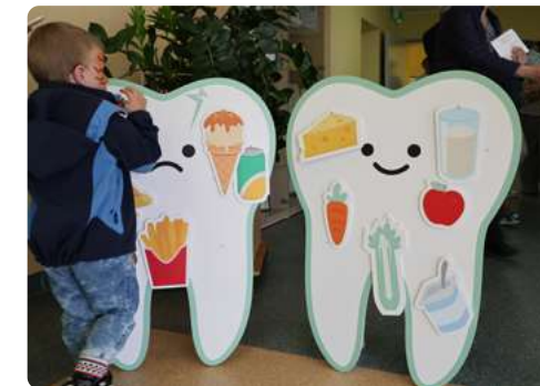
Interaktyvūs, edukaciniai žaidimai renginiuose

dalyviai dėliojo sveikatai palankios pietų lėkštės dėlionę, stiprindami žinias apie subalansuotos mitybos principus, o fizinio aktyvumo stotelėje vaikai ir jaunimas galėjo išbandyti savo taiklumą ir judrumą.