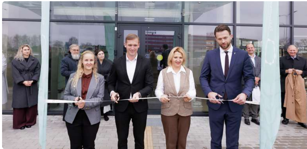
Naujųjų Biuro patalpų atidarymas

Lapkričio 10 d. buvo paminėta reikšminga Biuro sukaktis – vienerių metų nuo įsteigimo metinės, kurios sutapo su persikėlimu į naujas patalpas. Šia proga surengtas renginys, kurio metu svečiai turėjo galimybę susipažinti su naujomis biuro erdvėmis, įstaigos veikla, kasdieniais darbo procesais ir vertybėmis. Renginio metu simboliškai perkirtas atidarymo kaspinas, žymintis naujo veiklos etapo pradžią, Biuro augimą, bendrystę ir kryptingą judėjimą pirmyn.